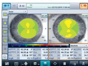
Dual map axial